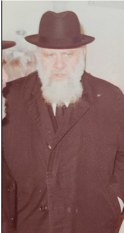
R' Simcha Wasserman